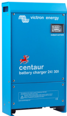
Centaur Battery Charger 24 30